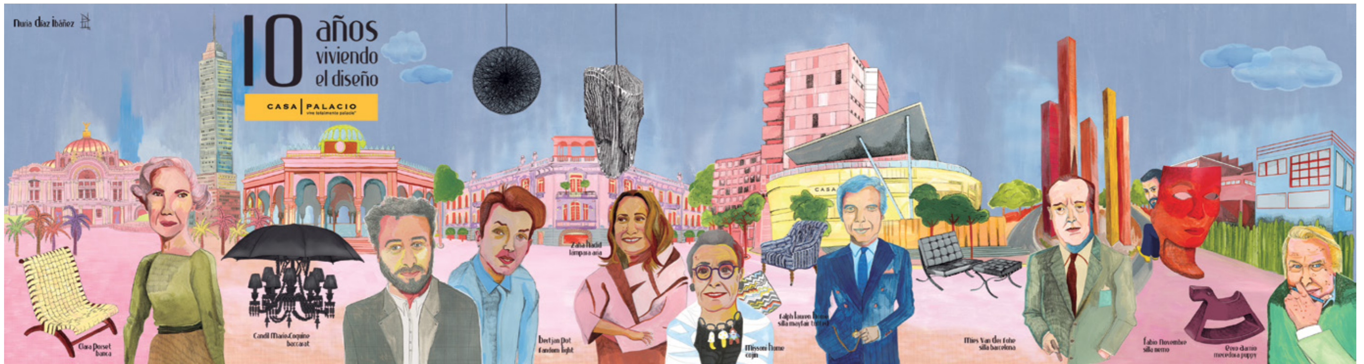
Ilustración por Nuria Díaz