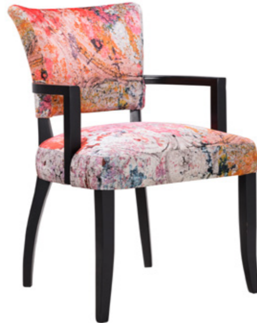
Silla de comedor Mimi con brazos F&D Peeling Ceiling & Black

La renovación del espacio de Timothy Oulton en Antara estará listo a fin de año. Conoce los detalles en nuestro blog, vivetotalmentepalacio.com , y redes sociales.