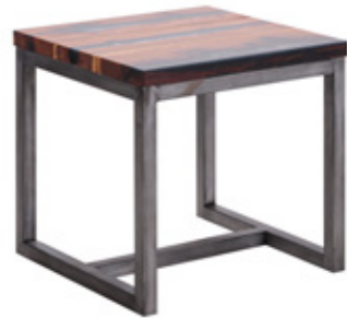
Mesa lateral Trapt

han incorporado a la oferta de Casa Palacio, no solo en Antara, sino también en Santa Fe y dentro de El Palacio de Hierro Monterrey. Entre las novedades están los módulos del sofá “Zenna”, con los que puedes armar una pieza personalizada acorde a tu gusto y necesidades de espacio. También las nuevas interpretaciones de la silla “Mimi”, un modelo clásico, pero que sigue ofreciendo nuevas posibilidades.