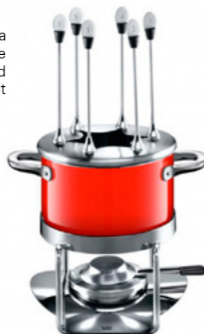
Kit para Fondue Energy Red de Silit

Te invitamos a ser parte de nuestro Taller de Cocina en Casa Palacio Antara. Más información en tienda.