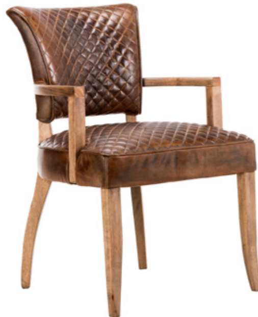
Silla de comedor Mimi con brazos Buck'd N Brok'n