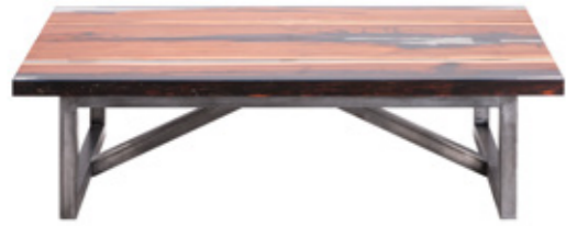
Mesa de centro Trapt